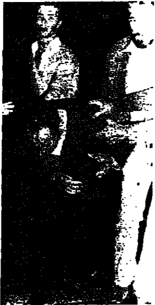
اصيب بضربة على راسه

وقالت المصادر ان الجنرال اليساري اوفيلو دي كارفالهو رفض طلباً قدم اليه ، ويقضي بتدخل قوات الجيش لاطلاق سراح ازويدو الذي اجبر على ملازمة مكتبه لمدة ايام متتالية - ووصفت المصادر تصرف كارفالهو بأنه عدم ولاه ساهم بزيادة من الانقسام الذي تصبى منه القيادة العسكرية . وراى المراقبون في هذه النتيجة انتصاراً تكتيكياً لحملة الجناح اليساري المتطرف الذي يدعو الى حكم شعبي اكثر فعالية يستجيب لتساؤلات السياسة التي تتخاضها المجالس المحلية للجان العمالية . وكانت هذه المجالس قد انشئت على فراخ تلك التي اعقبت الثورة البلشفية في روسيا السنة ١٩١٧ . والارتبنتيجة تلك كنهياً بان الحكومة قد تنقل الى المناطق المحاذية لتفادي خطر اليساريين الذي لا يكاد يتجاوز بعض الاممعة . وكان الجنرال ازويدو قد لجأ الى مل هذا الاحتمال منذ شهر . وكان رد الفعل فوراً في الشمال المحافظ ، فقد اصيب ١١ شخصاً خلال تبادل اطلاق النار في مدينة اوبورتو الحاققة امس الاول ، اثناء الهجوم على اهداف يسارية هناك . لشبونة - ر ، وصراف